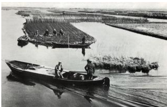
Aan de windkant bleef het riet staan, zodat de golfslag gebroken werd.

Maar het bestuur kijkt ook hoe riet kan helpen om ook op andere plaatsen oevers van akkers die zijn aangetast weer vast te leggen of te voorkomen dat plaatsen waar het nu nog goed gaat ook worden aangetast. Dat is niet in overeenstemming met het verleden, maar is nu wel nodig omdat we behalve van wind en vaarverkeer ook veel last hebben van de Amerikaanse rivierkreeft en ratten. Riet kan volgens deskundigen helpen om de kreeft tegen te houden. We willen daarom een rietkraag die om hele akker loopt.