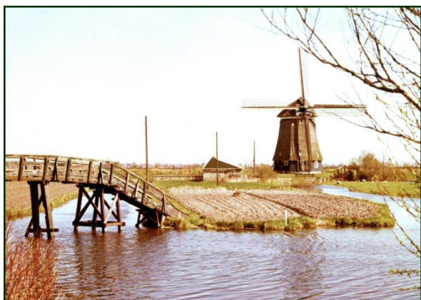
Akkers met grasstroken