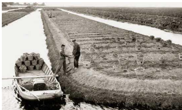
Op deze foto is goed te zien hoe het paadje om het hele eiland liep.

Het bestuur wil dit jaar gaan gebruiken om te kijken in hoeverre deze oude situatie weer kan worden hersteld, zodat de afkalving van de oever kan worden gestopt. Dat zal niet altijd makkelijk zijn, omdat op veel plaatsen de oever nu te steil is om gras in te zaaien. We zijn nu aan het bekijken hoe we dat samen met de huurders kunnen gaan oplossen.