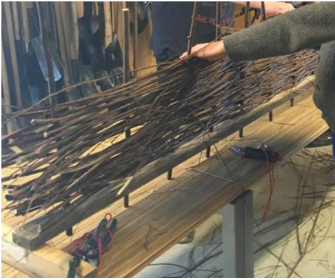
Het vlechten van matjes van wilgentakken.

oeverschade kleine gaten opvullen met rietpollen uit de omgeving en/of eventueel met wilgenmatjes.