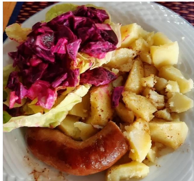
Een oer Hollandse maaltijd: bietensalade, rookworst en vers gerooide aardappels.

Bent u na het lezen van dit verhaal enthousiast geworden om te komen meehelpen, meldt u dan aan bij vrijwillger@oosterdel.nl of ga een keertje mee en ervaar het zelf of het iets voor u is. Wij kunnen uw hulp heel goed gebruiken.