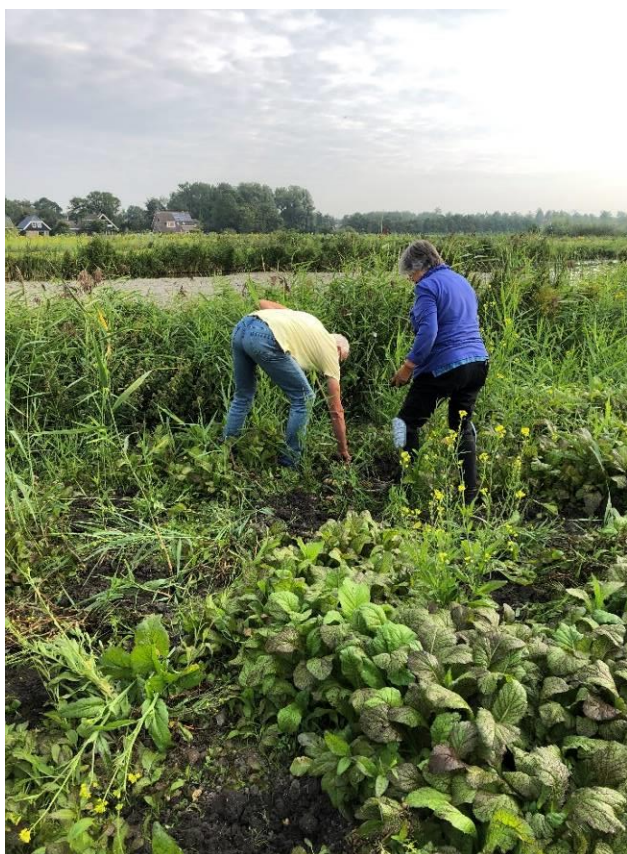
Herik, het staat er vol mee.