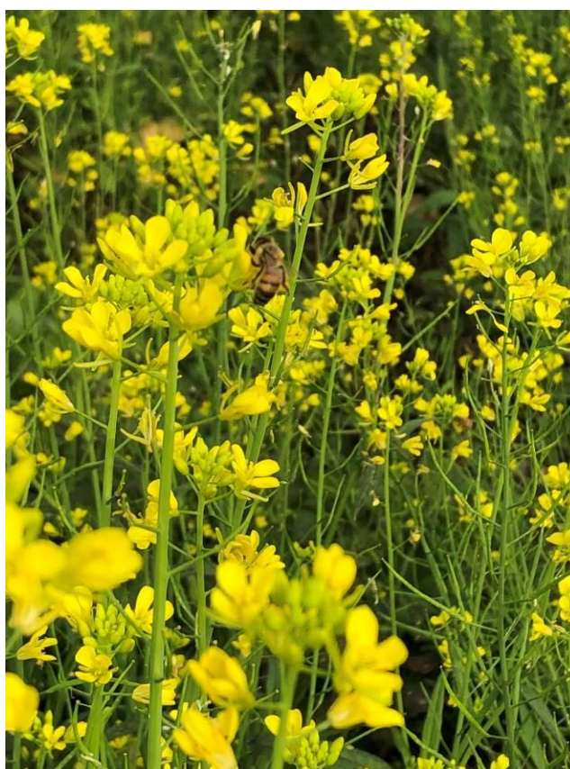
Als de plant bloeit is het een eldorado voor bijen.