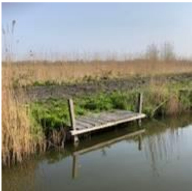
Dit niet, want onder de steiger kalft de oever af

Steigers vallen onder bouwwerken en zijn niet toegestaan. Een balk of opstaphekje mogen wel. Zij beschadigen de oever niet.