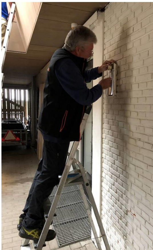
Zo, de verlichting doet het ook weer.

Dan op 4 september weer maaierwerk te doen. Ook deze keer is er weer een vrijwilliger ingewijd in de vaarkunst. Op deze manier krijgen we steeds meer mensen die kunnen varen, zodat het steeds makkelijker wordt om onze vrijwilligers op de akker te krijgen. De volgende stap wordt nu een aantal mensen op leiden die trekker kunnen rijden en werktuigen kunnen bedienen. Als we namelijk meer vrijwilligers hebben die zowel met de trekker als de schuit kunnen omgaan, dan kunnen we met groot materiaal onze akkers maaien en frezen en dat gaat een stuk sneller dan met bosmaaier en ferrari. Maar tot die tijd gaan we stug door met de middelen die we hebben.