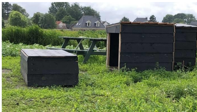
Dit kan wel, shutststal en gereedschapskist.

Een shutststal mag alleen als er dieren op de akker worden gehouden, geen dieren, geen shutststal. De gereedschapskist moet op 1 november van de akker (te beginnen in november 2022) evenals alle andere materialen die niet van nature op de akker voorkomen.