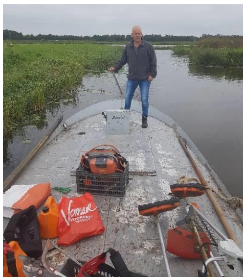
en met succes.