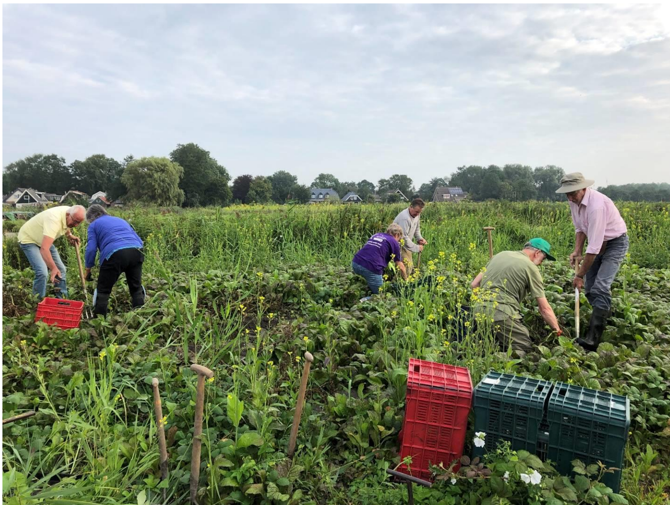
En dan aan het werk. Speuren naar de piepers, want die waren lastig te vinden tussen de herik.