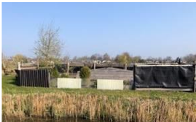
Dit dus niet, teveel bebouwing, schuttingen, plastic.