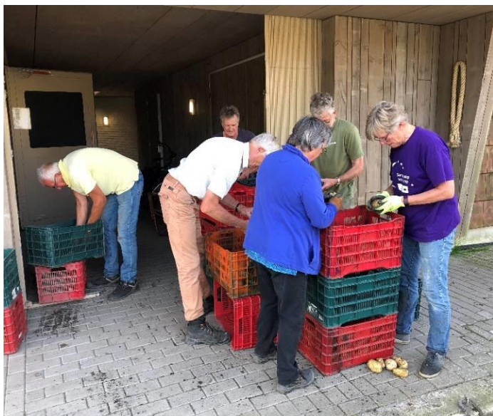
Piepers uitzoeken op beschadigde, groene exemplaren.

Na terugkomst op d' Oostkant moesten alle aardappels nog een keer door de handen gaan om de zieke, aangevreten en groene exemplaren eruit te halen die er op de akker per ongeluk tussendoor geglipt zijn. Die aardappelen zijn niet geschikt om te verkopen. Wel konden de vrijwilligers zelf een maaltje piepers meenemen uit de afgekeurde exemplaren, want als je het groene stuk of het deel dat aangevreten is eraf snijdt heb je een hele lekkere aardappel.