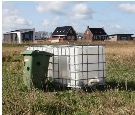
Dit kan dus niet.