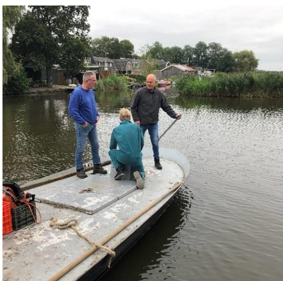
Onze penningmeester (geknield) geeft vaarles

Dan op 4 september weer maaierwerk te doen. Ook deze keer is er weer een vrijwilliger ingewijd in de vaarkunst. Op deze manier krijgen we steeds meer mensen die kunnen varen, zodat het steeds makkelijker wordt om onze vrijwilligers op de akker te krijgen. De volgende stap wordt nu een aantal mensen op leiden die trekker kunnen rijden en werktuigen kunnen bedienen. Als we namelijk meer vrijwilligers hebben die zowel met de trekker als de schuit kunnen omgaan, dan kunnen we met groot materiaal onze akkers maaien en frezen en dat gaat een stuk sneller dan met bosmaaier en ferrari. Maar tot die tijd gaan we stug door met de middelen die we hebben.