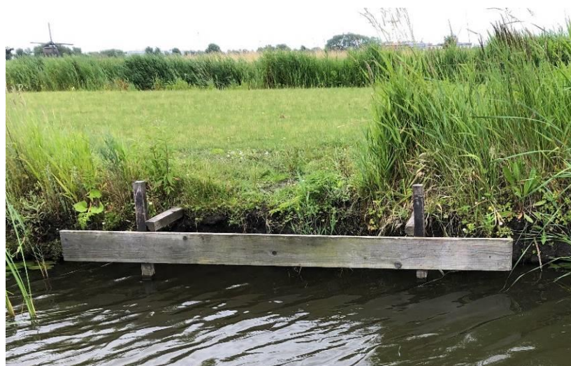
Dit kan wel, want de oever blijft in het licht en de planten kunnen gewoon doorgroeien. De oever blijft in tact.