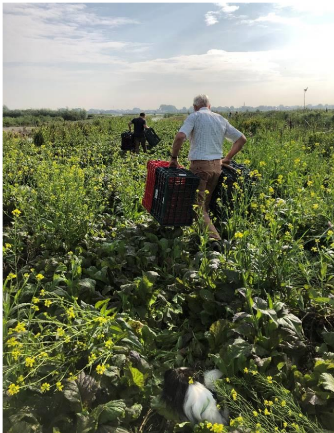
Nog maar even wat kratjes van de schuit gehaald.

Na terugkomst op d' Oostkant moesten alle aardappels nog een keer door de handen gaan om de zieke, aangevreten en groene exemplaren eruit te halen die er op de akker per ongeluk tussendoor geglipt zijn. Die aardappelen zijn niet geschikt om te verkopen. Wel konden de vrijwilligers zelf een maaltje piepers meenemen uit de afgekeurde exemplaren, want als je het groene stuk of het deel dat aangevreten is eraf snijdt heb je een hele lekkere aardappel.