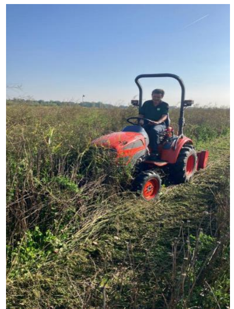
Trekker met klepelmaaier