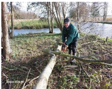
Gevelde bomen inkorten

In de loop van december zijn we ook weer gestart met het kappen van bomen aan de noordzijde van ons gebied. Het betreft bomen die aan het eind van hun levensduur zijn en in een aantal gevallen al spontaan zijn omgevallen. Dit heeft ook vooral te maken met de hoge