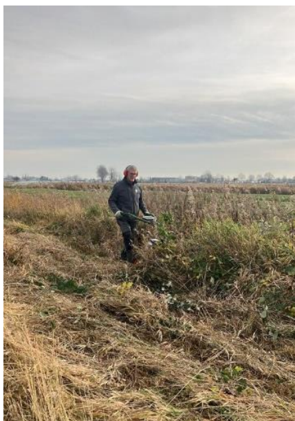
2-wielige tuinbouwmachine met maaibalk