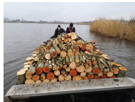
Houtaanvoer vanaf de boommakers

De omgezaagde bomen en grote takken worden eerst verkleind tot stammetjes van ongeveer 30 cm en daarna ofwel door de cliënten van Zorgboerderij Oosterheem ofwel door onze eigen vrijwilligers met behulp van een professionele kloofmachine verder verkleind. Er is veel belangstelling voor het hout dat we van af nu ook weer voor een heel redelijke prijs te koop aanbieden.